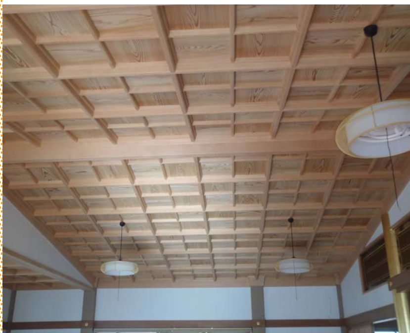
S寺本堂改修工事 天井：格天組 秋田杉無垢材