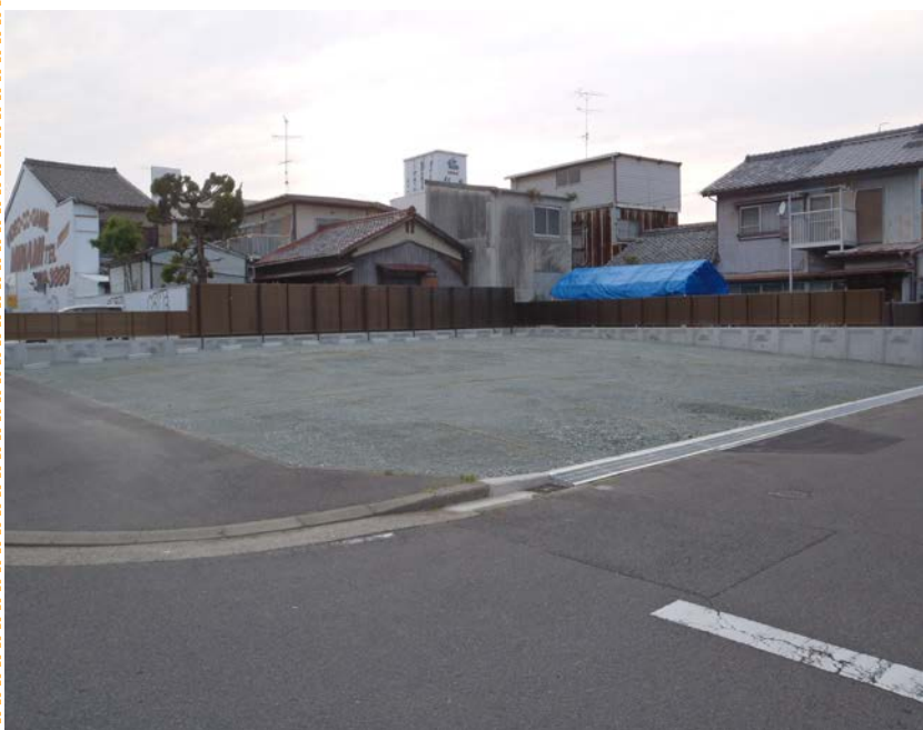
S様邸土留め工事 L型擁壁：ガードフェンスタイプ フェンス：シャレオ5型(リクシル) 土間：砕石敷込転圧(C-40-0)