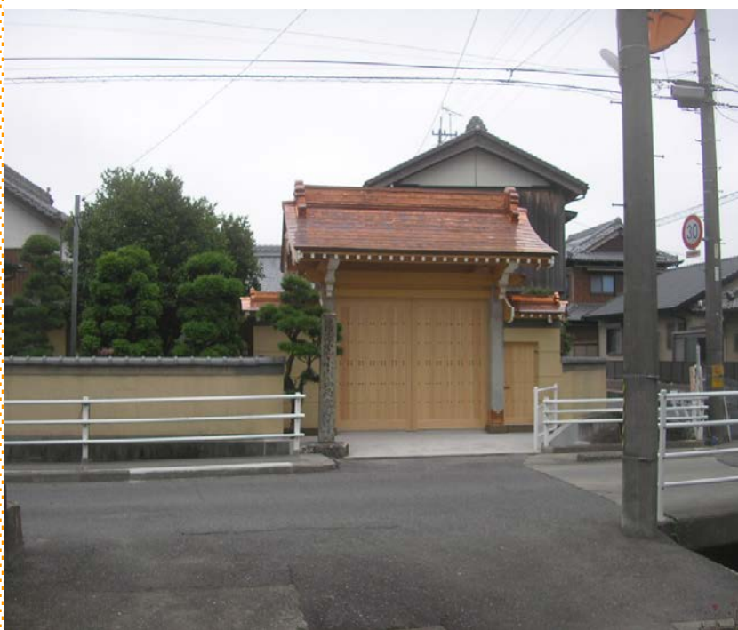
S寺山門工事 総検造り 屋根：銅板一文字葺