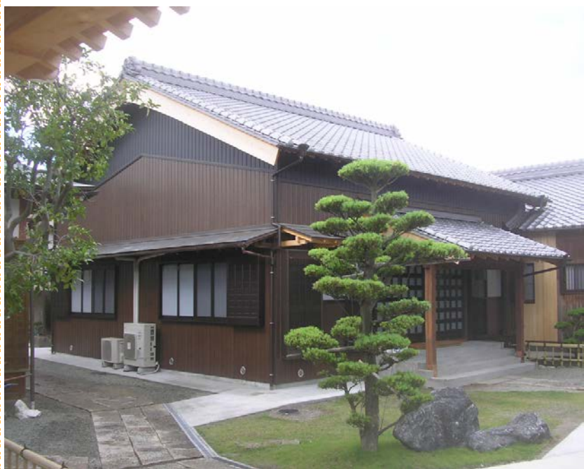
S邸様改修工事 築200年の民家再生工事です 構造材だけを残し内外装とも前面改装でした